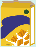
Une boîte de céréales vide