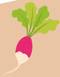
Une botte de radis